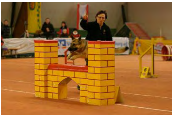
De gebruikte muur...