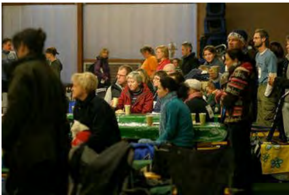
Ruimte publiek, achter de afzetting baan...