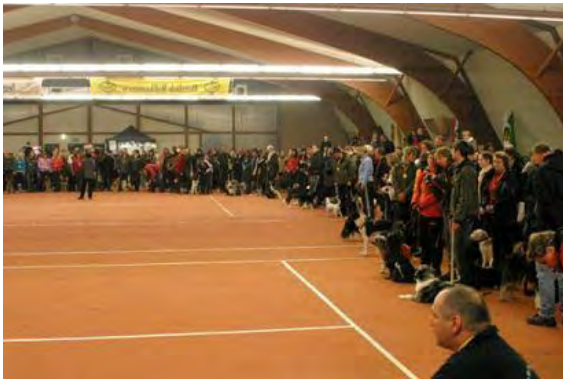
Presentatie van alle deelnemers...